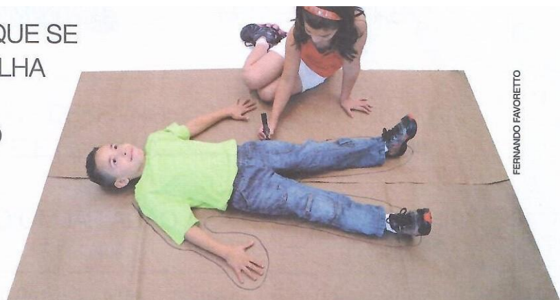
CRIANÇA DESENHANDO O MAPA DO CORPO DO COLEGA.

B) PEÇA A SEU COLEGA QUE SE DEITE SOBRE ESSA FOLHA DE PAPEL. COM UMA CANETA, CONTORNE O CORPO DELE. DEPOIS É A VEZ DELE: DEITE-SE SOBRE OUTRA FOLHA DE PAPEL PARA QUE ELE POSSA CONTORNAR O SEU CORPO.