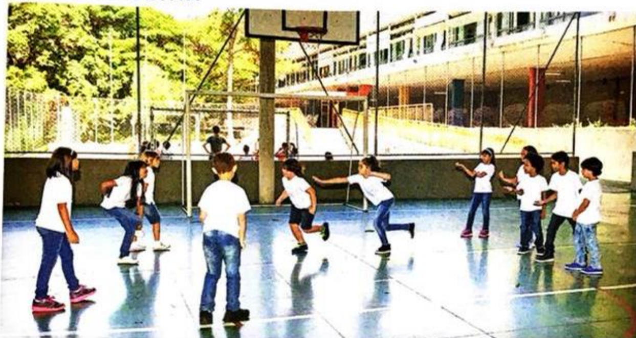
ALUNOS NA QUADRA ESPORTIVA, EM ESCOLA ESTADUAL NO MUNICÍPIO DE SÃO PAULO, NO ESTADO DE SÃO PAULO, EM 2017.