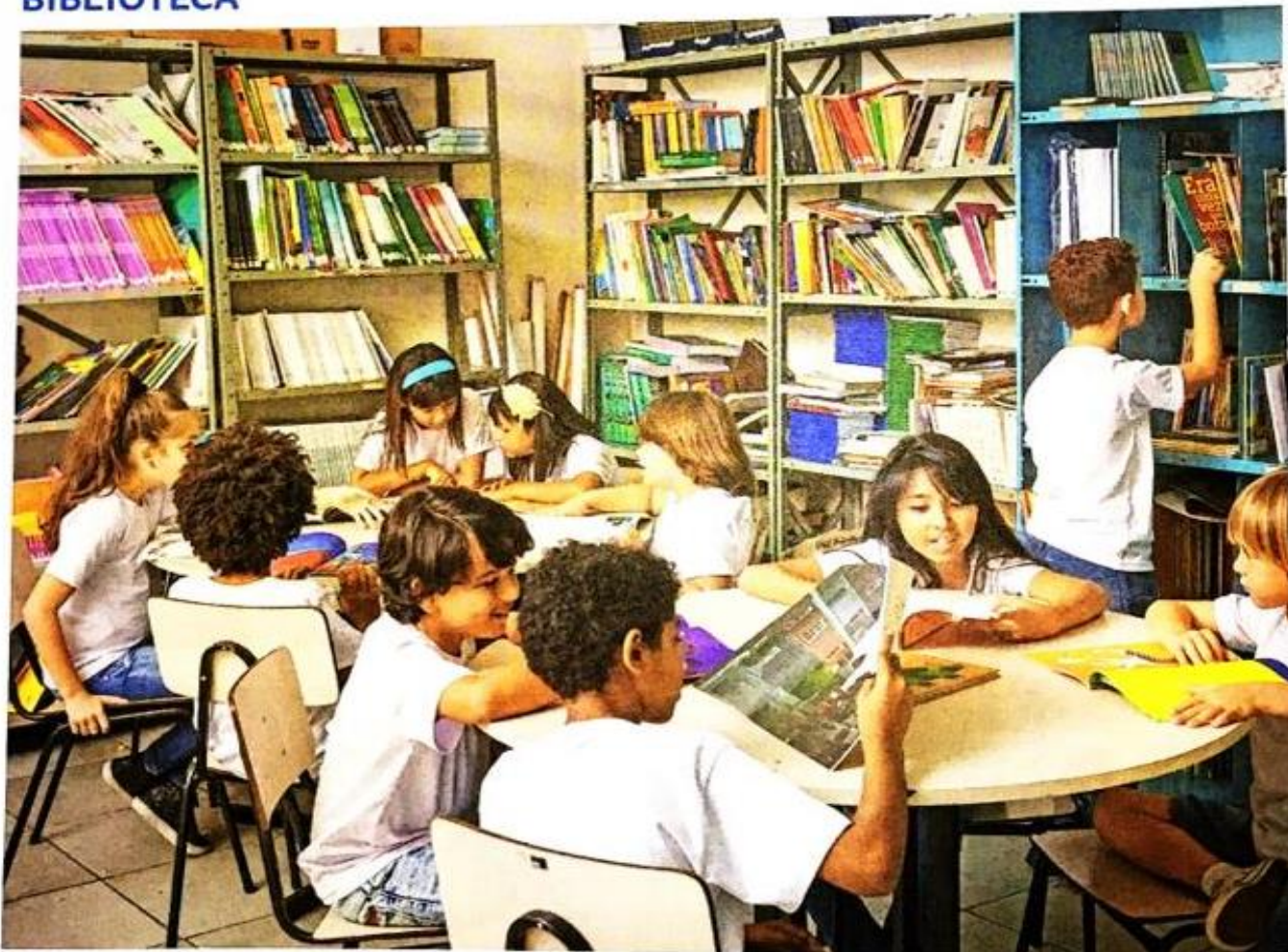
ALUNOS NA BIBLIOTECA, EM ESCOLA ESTADUAL NO MUNICÍPIO DE SÃO PAULO, NO ESTADO DE SÃO PAULO, EM 2017.