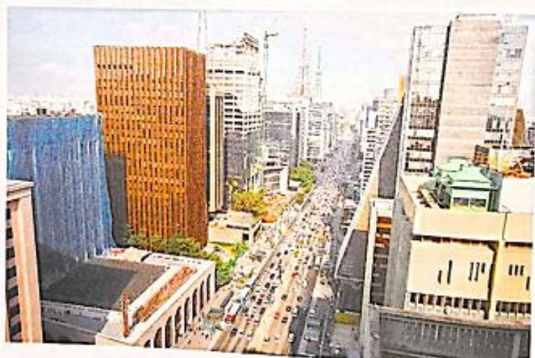
AVENIDA PAULISTA, NO MUNICÍPIO DE SÃO PAULO, NO ESTADO DE SÃO PAULO, EM 2014.