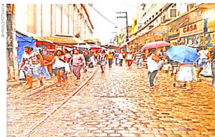
RUA DAS CALÇADAS, NO MUNICÍPIO DE RECIFE, NO ESTADO DE PERNAMBUCO, EM 2017.

LÚCIA GASPAR. SÃO JOSÉ (RECIFE, BAIRRO). PESQUISA ESCOLAR ON-LINE. RECIFE: FUNDAÇÃO JOAQUIM NABUCO, 29 JUN. 2004. DISPONÍVEL EM: < http://basilio.fundaj.gov.br/pesquisaescolar/index.php?option=com_content&view=article&id=406&Itemid=1 >. ACESSO EM: 13 NOV. 2017.