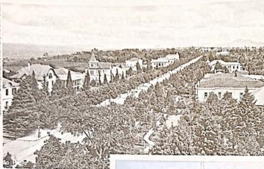
AVENIDA PAULISTA, NO MUNICÍPIO DE SÃO PAULO, NO ESTADO DE SÃO PAULO, EM 1902.