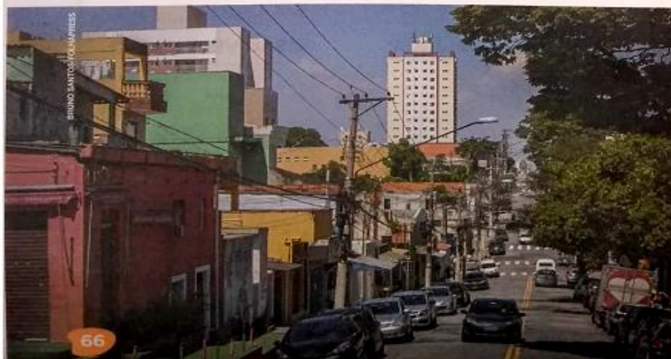
RUA NO BAIRRO DA MOOCA, NO MUNICÍPIO DE SÃO PAULO, NO ESTADO DE SÃO PAULO, EM 2016.