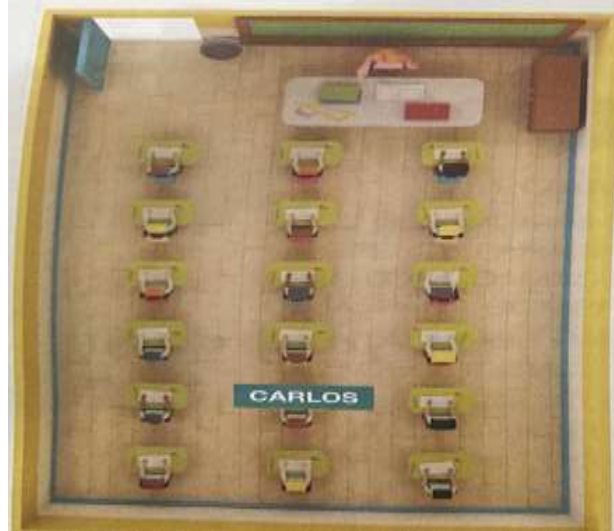
SALA DE AULA DE CARLOS.

1 OBSERVE AS SALAS DE AULA ONDE CARLOS E ADRIANA ESTUDAM.