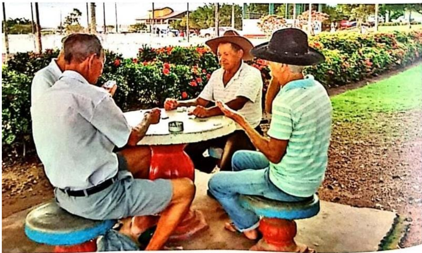
Amigos jogando dominó na Praça dos Colonizadores, no município de Juara, no estado de Mato Grosso, em 2016.

Jogo de dominó na praça central de Juara reúne amigos todos os dias. Rádio Tucunarê , 1º fev. 2016. Disponível em: < http://www.radiotucunare.com.br/juara/id-448754/jogo_de_domino_na_praça_central_de_juara_reune_amigos_todos_os_dias >. Acesso em: 17 ago. 2017