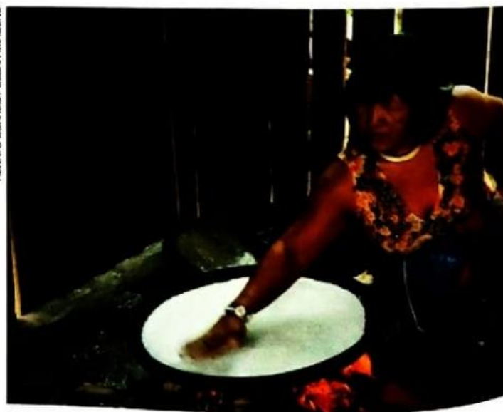
Mulher ikepang fazendo beiju, no município de Feliz Natal, no estado do Mato Grosso, em 2016.