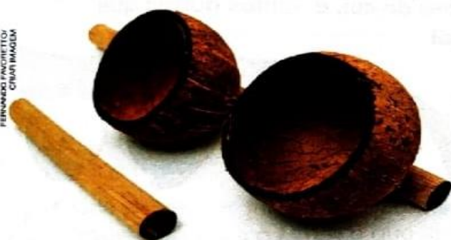
Agogô de casca de coco seco.

Música: os instrumentos agogô, atabaque e cuíca, utilizados nas danças e nos ritmos musicais brasileiros, são de origem africana.