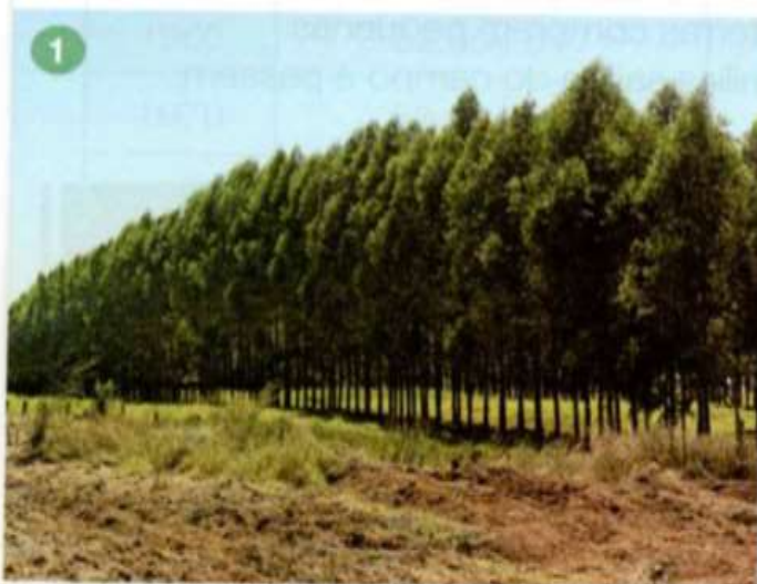
1 Plantação de eucaliptos no município de Goiânia, no estado de Goiás, em 2016.

A matéria-prima do papel é obtida no espaço rural. O eucalipto, por exemplo, costuma ser plantado para a obtenção de celulose, matéria-prima do papel. Observe as fotos na sequência indicada e leia as legendas.