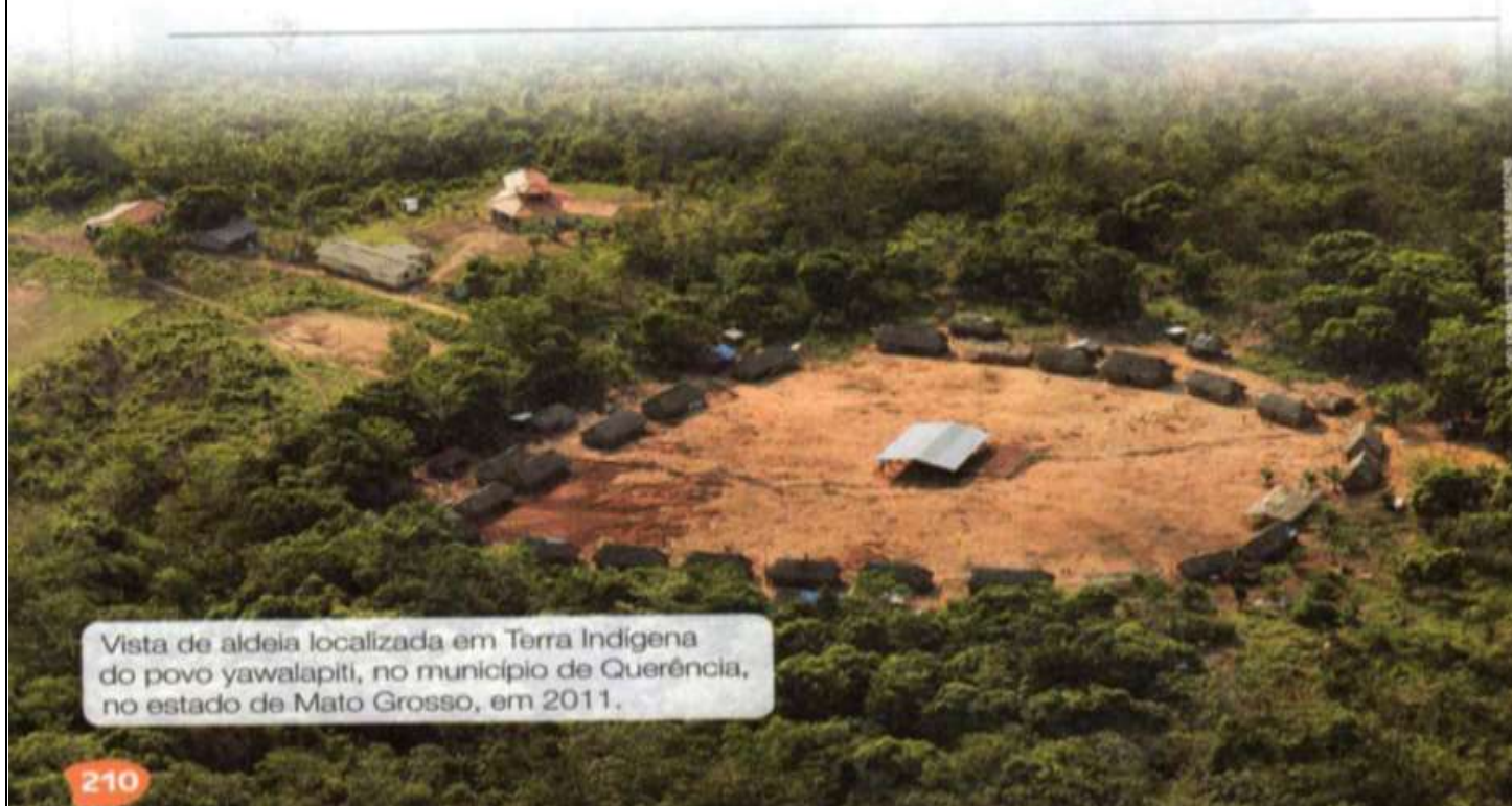
Vista de aldeia localizada em Terra Indígena do povo yawalapiti, no município de Querência, no estado de Mato Grosso, em 2011.