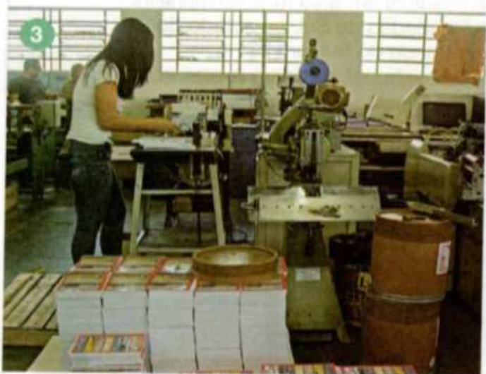
3 Interior de uma gráfica no município de Taquaritinga, no estado de São Paulo, em 2017.