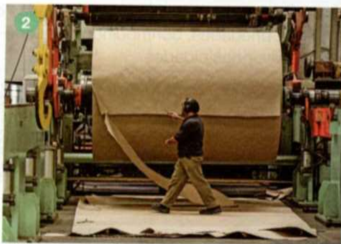
2 Na indústria de papel, a celulose é transformada em papel. Município de Piracicaba, no estado de São Paulo, em 2013.