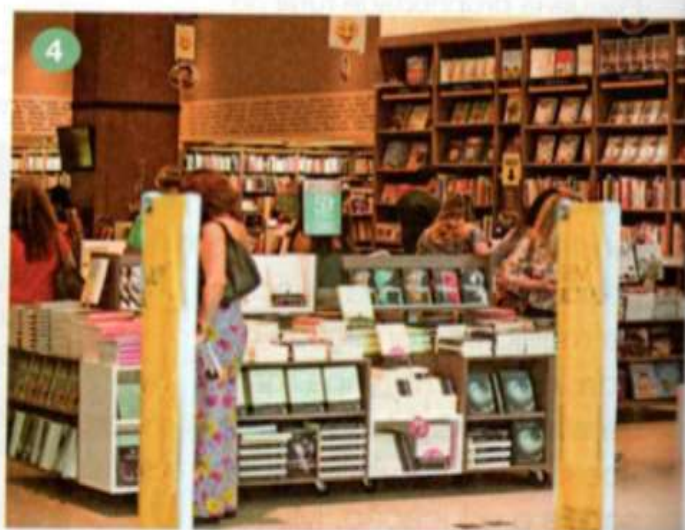
4 Livraria no município de Recife, no estado de Pernambuco, em 2017.

Como você observou, a matéria-prima é obtida no campo e depois encaminhada às indústrias para ser transformada em papel. Os livros são vendidos geralmente nas cidades e podem ser utilizados pelos moradores das cidades e do campo.