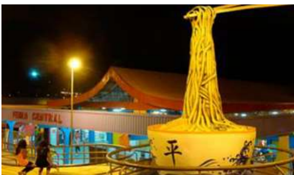
Figura 2: Disponível em: < http://feiracentralcg.com.br/noticias/ > . Acesso em: 11 de fevereiro de 2021

1. Os japoneses são um exemplo dos movimentos migratórios em Campo Grande/MS. Assinale qual foi o principal motivo da vinda desse grupo para o município.