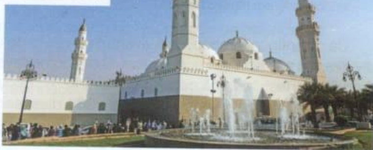
Mesquita de Masjid Quba, na cidade de Medina, na Arábia Saudita. A construção dessa mesquita teve início no ano de 622. Foto de 2017.