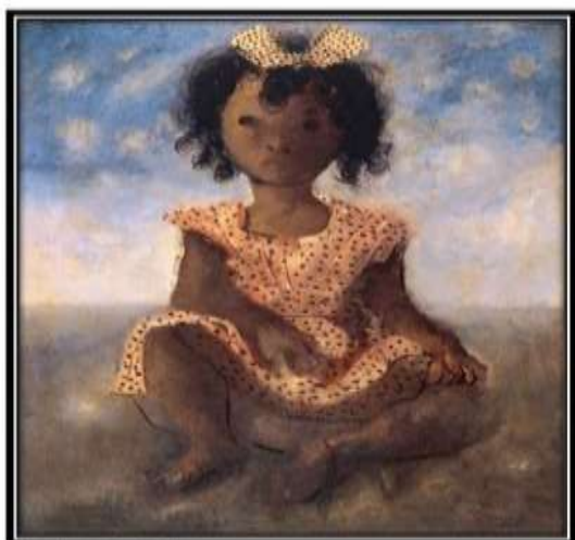
Menina sentada Candido Portinari. Brasil 1943. Óleo sobre tela, 60 x 74cm

AULA 04, 05 e 06 – Observe a obra e responda: