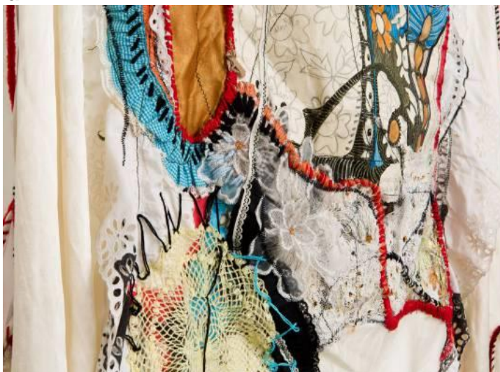
Figura 1 - Detalhe de Tecendo a Manhã I, de Sônia Gomes, 2016 (costura, amarrações, tecidos e rendas variados, 193 cm x 12 cm).