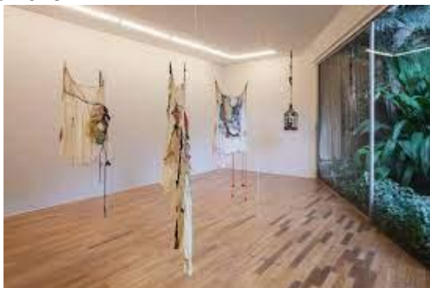
Figura 3 - Visão da exposição "Linhas em Tramas" de Sonia Gomes, realizada em São Paulo (SP), 2016.

Tecendo a Manhã I é parte de uma série de trabalhos de Sonia Gomes que foram exibidos na exposição individual ‘Linhas em tramas’, realizada pela artista em uma galeria da cidade de São Paulo, entre abril e agosto de 2016.