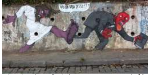
Grafite do artista de rua Paulo Ito, presente nas ruas de São Paulo