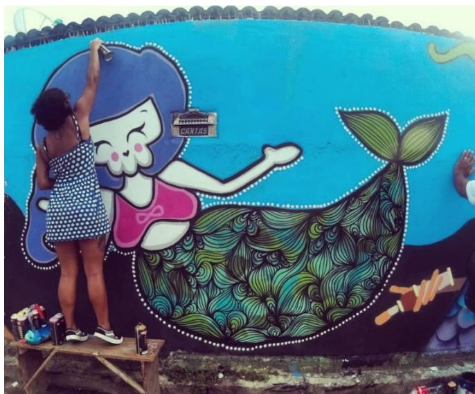
Figura 2 - Witch produzindo grafite, João Pessoa (PB), 2015.

Em muros e paredes das zonas urbanas das cidades, é comum observarmos pinturas e desenhos que ficam conhecidos como grafite. Na foto anterior você pôde observar a grafiteira Witch realizando um de seus trabalhos. A seguir, observe-a produzindo um de seus grafites.