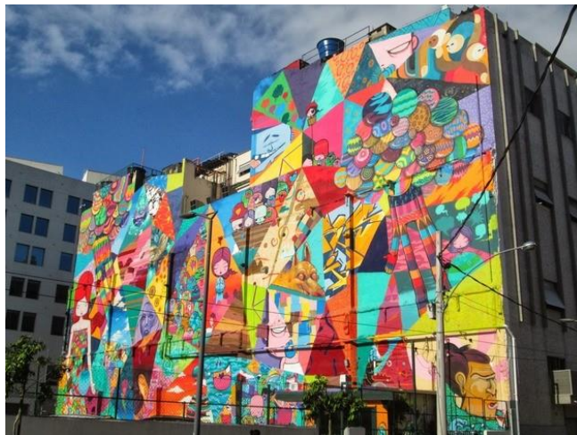
Figura 5 - Grafite do artista brasileiro Toz na Zona Portuária do Rio.

A arte do grafite é uma forma de manifestação artística em espaços públicos. A definição mais popular diz que o grafite é um tipo de inscrição feita em paredes. Existem relatos e vestígios dessa arte desde o Império Romano. Seu aparecimento na Idade Contemporânea se deu na década de 1970, em Nova Iorque, nos Estados Unidos. Alguns jovens começaram a deixar suas marcas nas paredes da cidade e, algum tempo depois, essas marcas evoluíram com técnicas e desenhos.