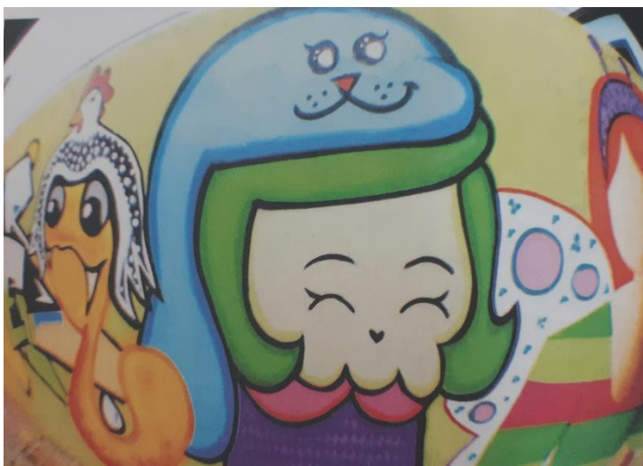
Figura 3 - Ao centro a personagem Catrina grafitada em uma parede, Duque de Caxias (RJ), 2012.