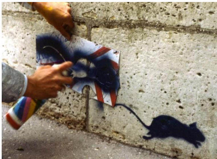
Figura 6 - Grafite feito com stencil.