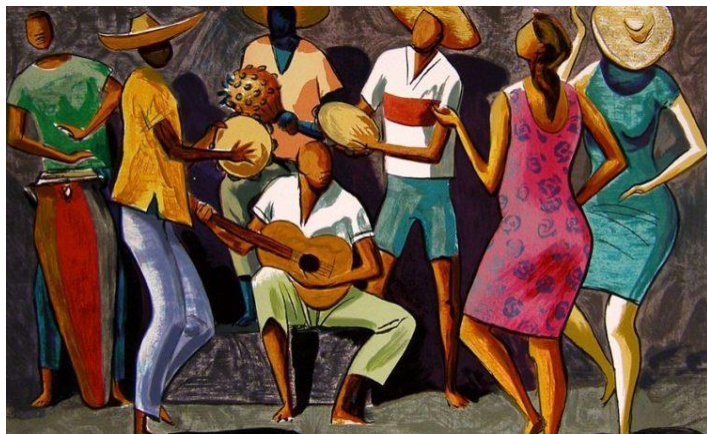
Roda de Samba, Carybé