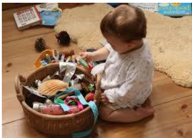
IMAGEM DO GOOGLE