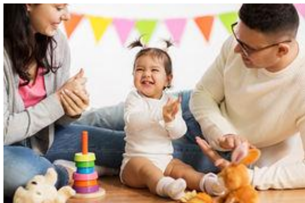
IMAGEM DO GOOGLE

GRAVE OU FILME SEU FILHO BATENDO PALMINHAS E FAZENDO GESTOS.