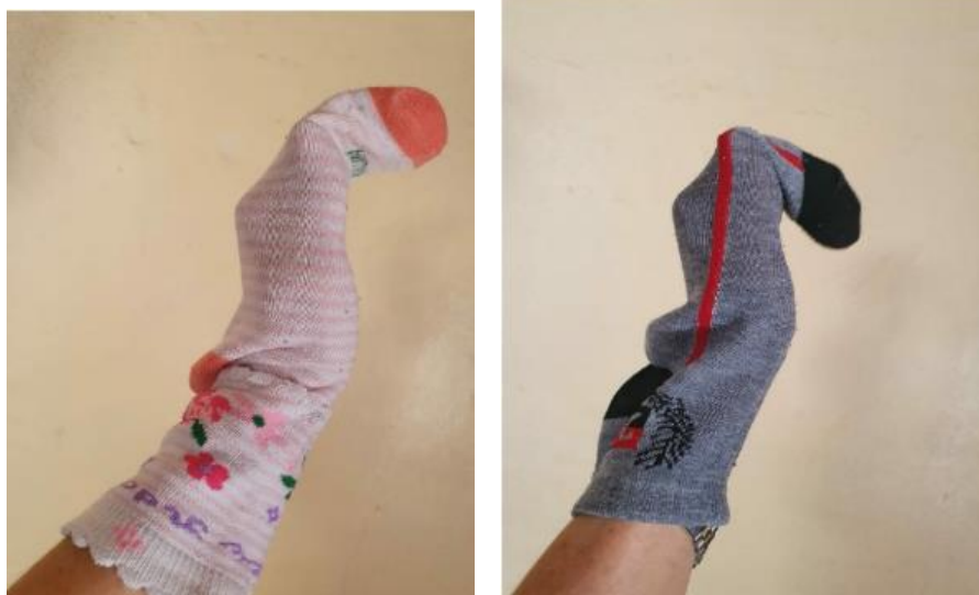
IMAGEM RETIRADA DO GOOGLE.

COLOQUE UM FANTOCHE FEITO DE MEIAS EM CADA MÃO E FAÇA COMO SE FOSSE BONECOS CONVERSANDO ENTRE ELES E COM O BEBÊ. ABUSE DAS VOZES DIFERENTES NOS DIÁLOGOS E ENVOLVA O BEBÊ NAS CONVERSAS, FAZENDO COM QUE OS BONECOS “FALEM” COM ELE TAMBÉM. USE OS BONECOS PARA FAZER CARINHOS E DAR BEIJINHOS NAS BOCHECHAS, NOS BRAÇOS E NAS PERNAS DO BEBÊ.