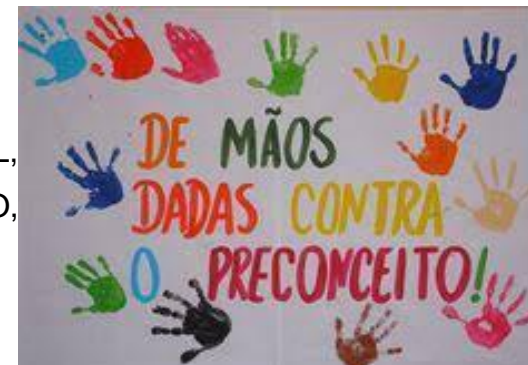
IMAGEM RETIRADA DA INTERNET

UTILIZAR TINTA GUACHE NAS CORES QUE TIVEREM DISPONÍVEIS COMO: VERMELHO, VERDE, AZUL, AMARELO, MARROM, PRETA, BRANCA E CARIMBAR AS MÃOS EM UM PAPEL BRANCO, SIMBOLIZANDO: "DE MÃOS DADAS CONTRA O PRECONCEITO".