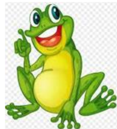
IMAGEM RETIRADA GOOGLE