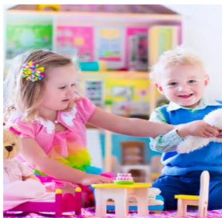
IMAGEM RETIRADA DO GOOGLE.

VAMOS ASSISTIR AO VÍDEO JOÃOZINHO BRINCANDO DE CASINHA DISPONÍVEL, EM: