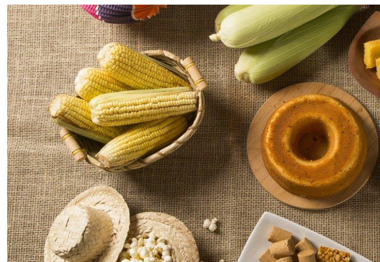
Comidas típicas de festa junina –