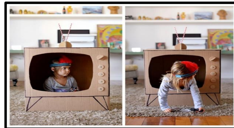
IMAGEM RETIRADA DA INTERNET